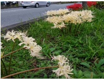
浮花橋の先の道路沿いに咲いていた彼岸花です。紅白で咲いていまし