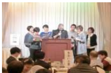
事業所実践発表会