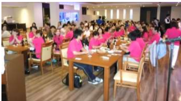
27年6月新人歓迎会 足立区役所メヒコにて