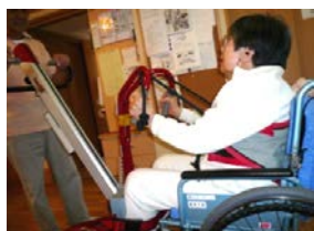
* クイックレイザーによる移乗風景